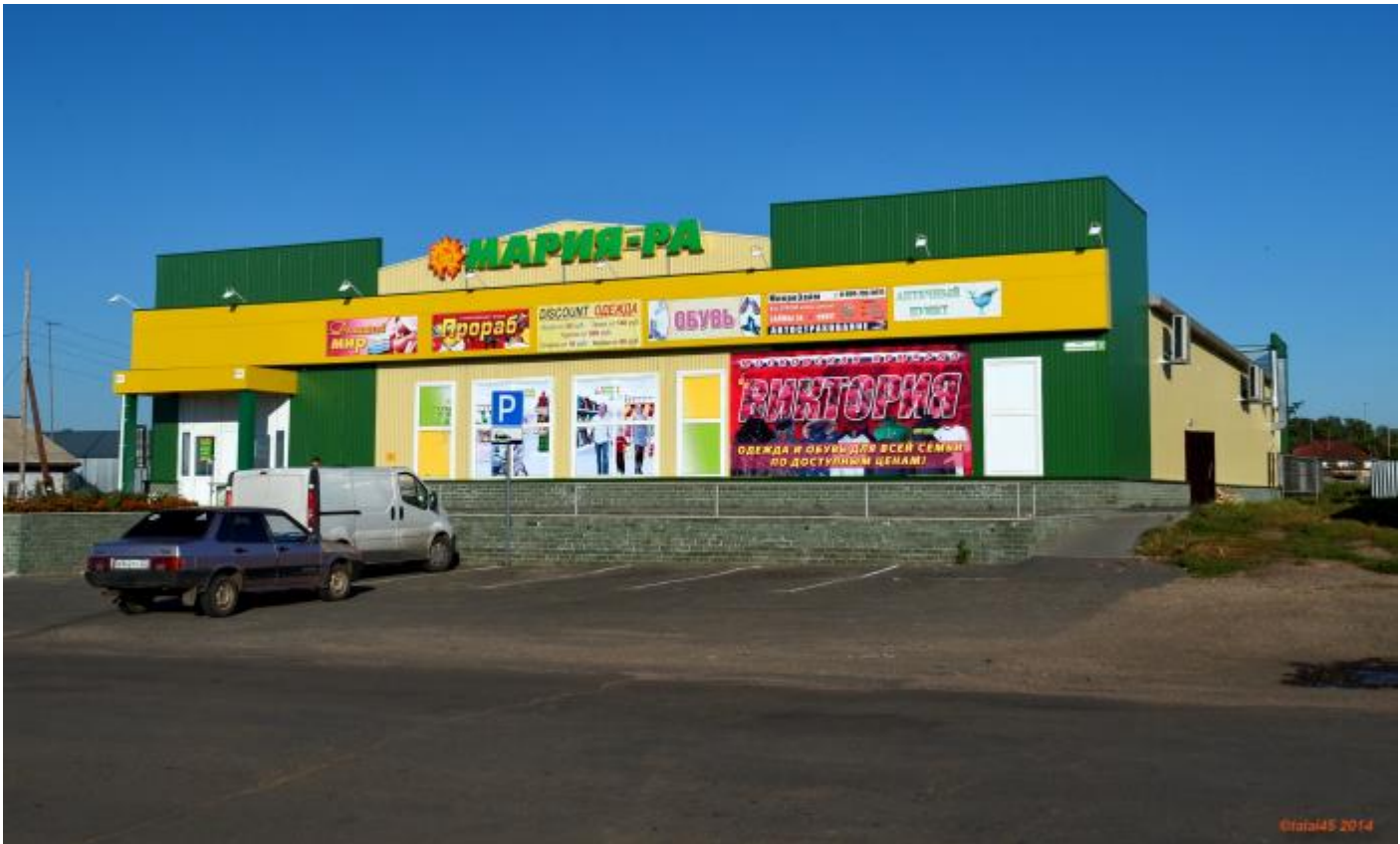
Рисунок 2 - Магазин № 896 К-1» ТЦ «Мария Ра»

ТЦ «Мария-Ра» форматами и у количество позиций которых в от от до тыс. ед. супермаркетов Ра» являются: